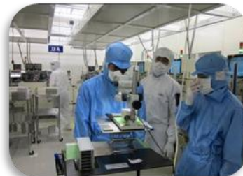
企業実習プログラム

企業の方々からは熱心にご指導いただき、生徒、教員にとって貴重な体験になった。近くの工場でこのようにすごいものを作っていることを知ったり、技能検定等の資格の大切さを改めて知ったりする好機となった。また、現場の雰囲気や緊張したり、仕事の大切さや大変さを改めて感じるなど、多くの成果を残すことができた。しかし、多くの課題も見つかった。それは、実習先各企業についての事前学習（知識・技能）の時間が取れないため、口頭だけの説明になったり、各班のローテーション形式であるため、同じ内容を繰り返し指導する必要があるため、企業にとっての負担となっている。また、生徒のスキル向上に関しては評価が難しく、レポートとヒヤリングが主な評価材料である。これらのことから、平成23年度は実施せず、2年間の取り組みとなった。