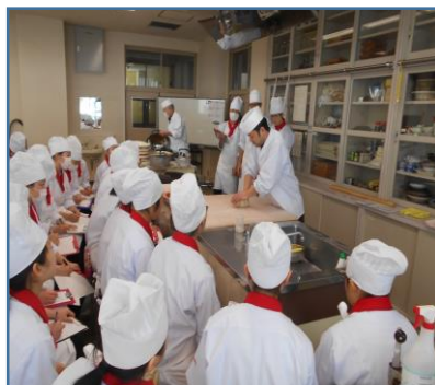
写真② そば打ち教室