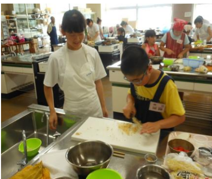
写真① 子供料理教室