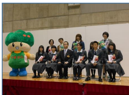
写真④ エコクッキング表彰