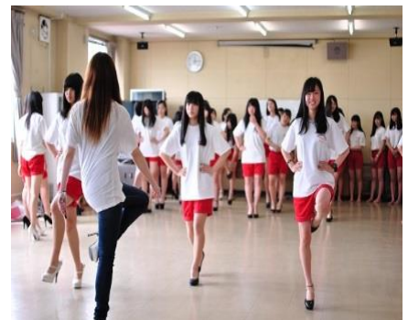
写真③ ウォーキング講習会