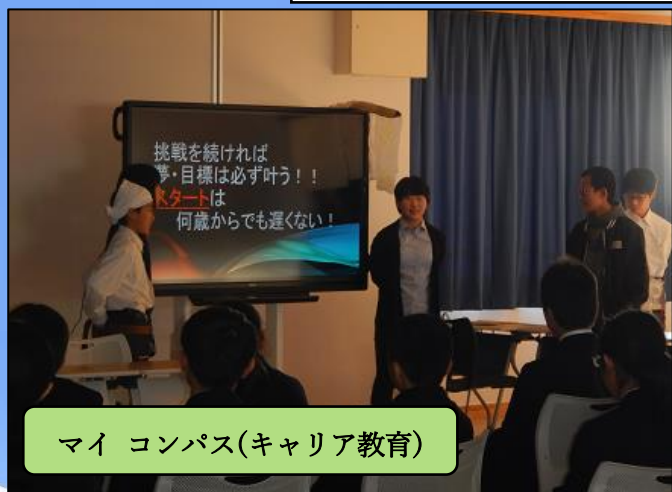
マイコンパス(キャリア教育)