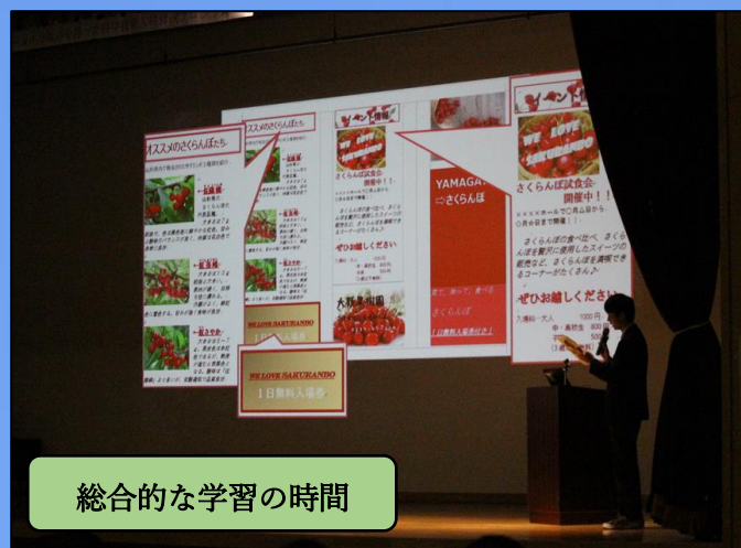
総合的な学習の時間

【その他】当日の駐車場等の情報は、後日、本校HPでご案内いたしますのでご覧ください。ご不明な点等は、中学教頭までご連絡ください。