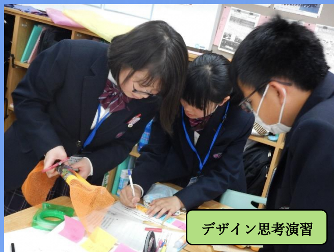
デザイン思考演習

【その他】 当日の駐車場等の情報は、後日、本校HPでご案内いたしますのでご覧ください。ご不明な点等は、中学教頭までご連絡ください。(0237-53-1541)